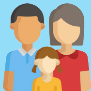
Famille & Patrimoine